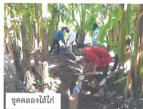
ขุดคลองไส้ไก่