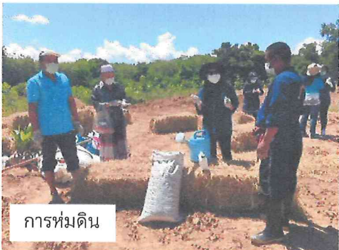
การห่มดิน