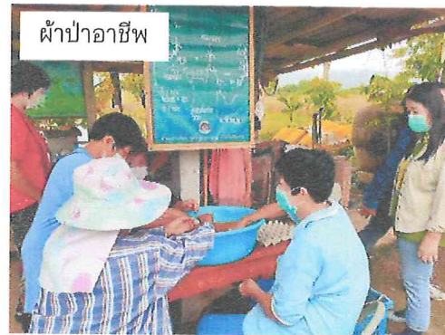
ผ้าป่าอาชีพ