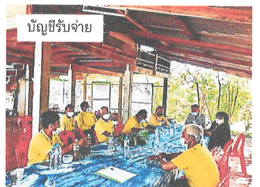
บัญชีรับจ่าย