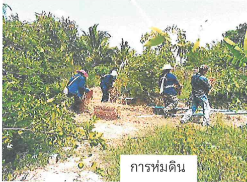
การห่มดิน