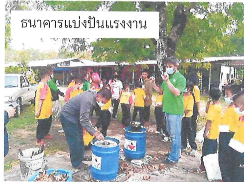
ธนาคารแบ่งปันแรงงาน