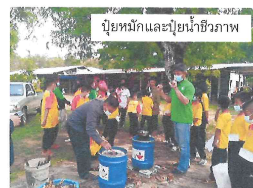
ปุ๋ยหมักและปุ๋ยน้ำชีวภาพ