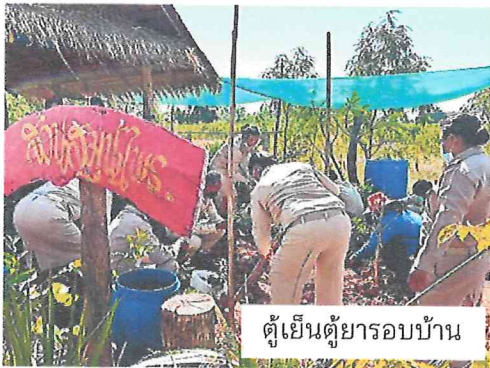
ตู่เย็นตู่ยารอบบ้าน