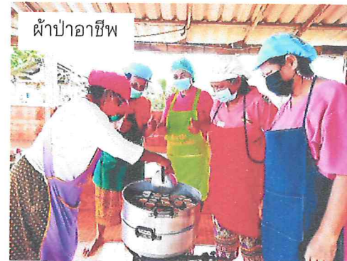
ผ้าป่าอาชีพ