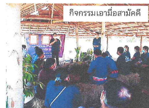
กิจกรรมเอามื้อสามัคคี