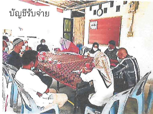
บัญชีรับจ่าย