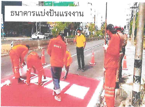
ธนาคารแบ่งปันแรงงาน