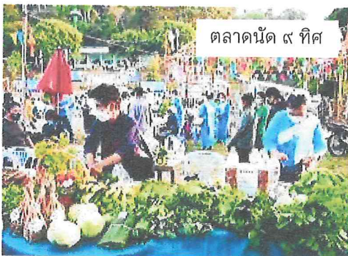
ตลาดนัด ๙ ทิศ