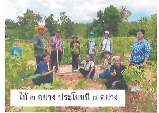
ไม้ ๓ อย่าง ประโยชน์ ๔ อย่าง