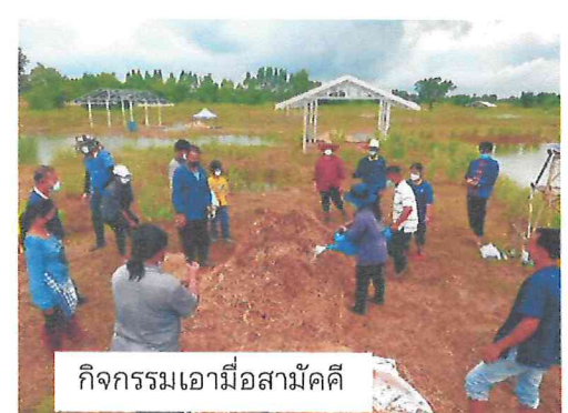
กิจกรรมเอามื้อสามัคคี