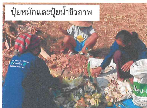
ปุ๋ยหมักและปุ๋ยน้ำชีวภาพ