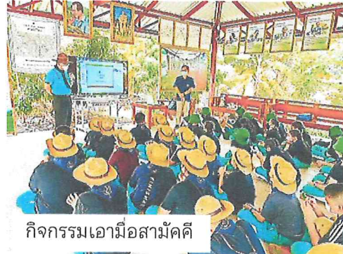
กิจกรรมเอามื้อสามัคคี