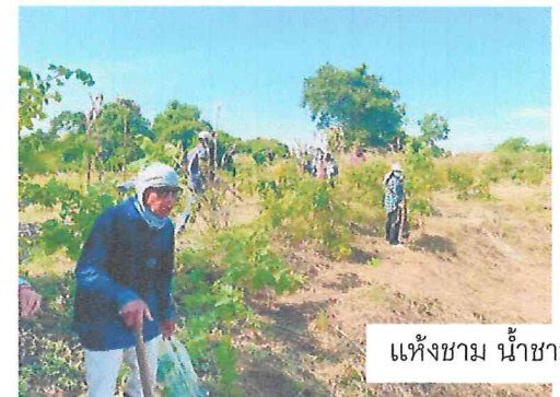
แห้งชาม น้ำชาม