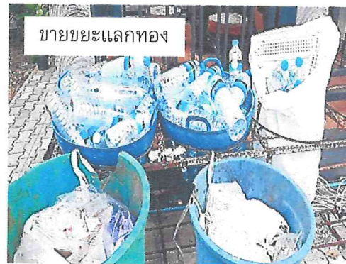
ขายขยะแลกทอง