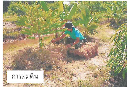
การห่มดิน