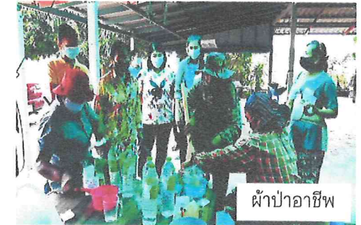
ผ้าป่าอาชีพ