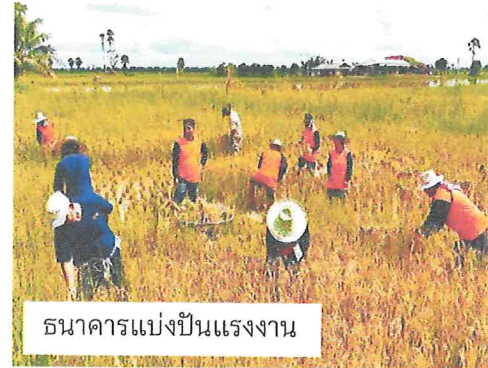
ธนาคารแบ่งปันแรงงาน