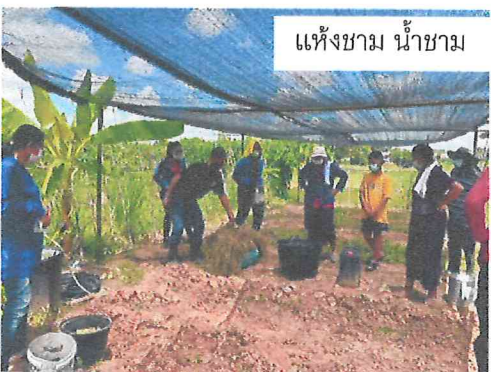
แห้งชาม น้ำชาม