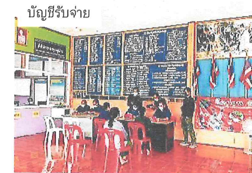
บัญชีรับจ่าย